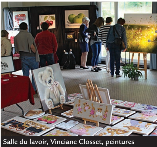
Salle du lavoir, Vinciane Closset, peintures