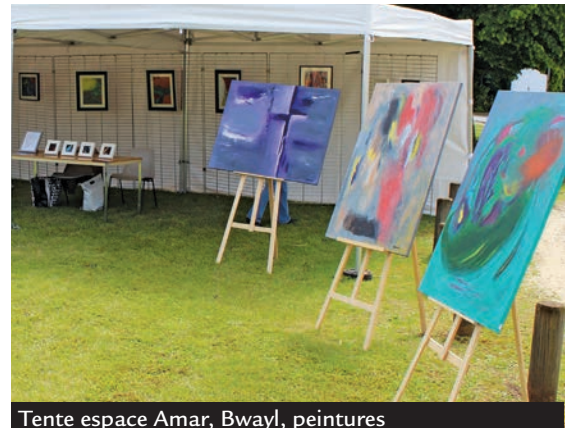
Tente espace Amar, Bwayl, peintures