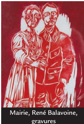
Mairie, René Balavoine, gravures