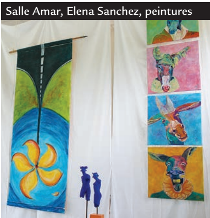
Salle Amar, Elena Sanchez, peintures